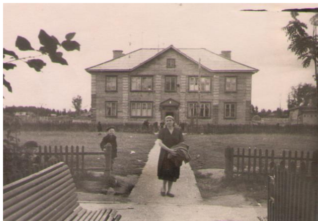
Возле барака (современная территория храмового комплекса)

Она устроилась работать в Лесной Городок поваром в санаторий. Потом перешла в ресторан, в аэропорт Внуково, и с тех пор все время там работала. Готовила Никите Сергеевичу Хрущеву, (она рассказывала: «Никитка мне руку жал!»). Готовила Брежневу, когда они приезжали со всей свитой. Была заведующей цехом холодных закусок, прекрасно готовила заливные. Работа была сменная, тяжелая. А вышла на пенсию – и больше уже не работала. Тут, как раз, и внук появился. Но сказать, что на пенсии она сидела дома – нет, её дома никогда не было. Когда случилась трагедия в доме, погиб трагически ее сын в 1990 году – она очень страдала, молилась, просила всех молиться. Ездил в монастыри, когда была возможность. В первые годы ее дома-то даже и не было, она все время ездила. Мы с ней ездили в храм, чаще в Преображенский храм в Переделкино (не забывая, конечно, и о Большом Свинорье).