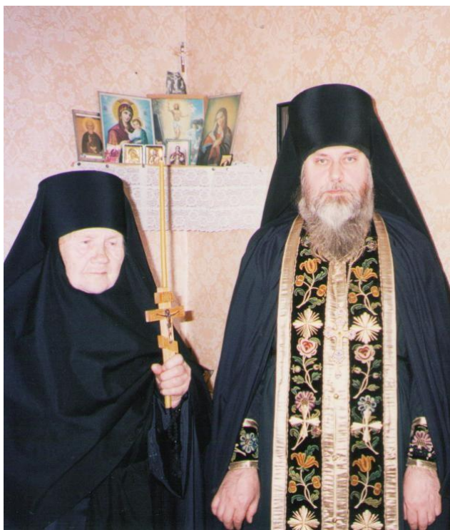
В день пострига