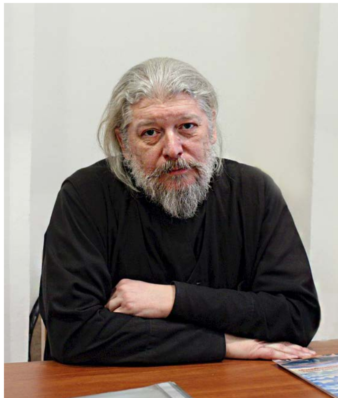
Протоиерей Алексей Уминский