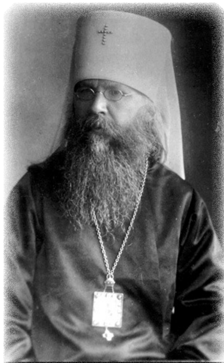
Митрополит Вениамин (Кашинский)

спокойно. Среди разгулявшейся анархии ему удавалось поддерживать мало-мальски активную церковную жизнь, сохранять существование духовных школ, спасать храмы от разорения. Деятельный и гибкий администратор – он добивался от советской власти уступок и социальных гарантий духовенству.