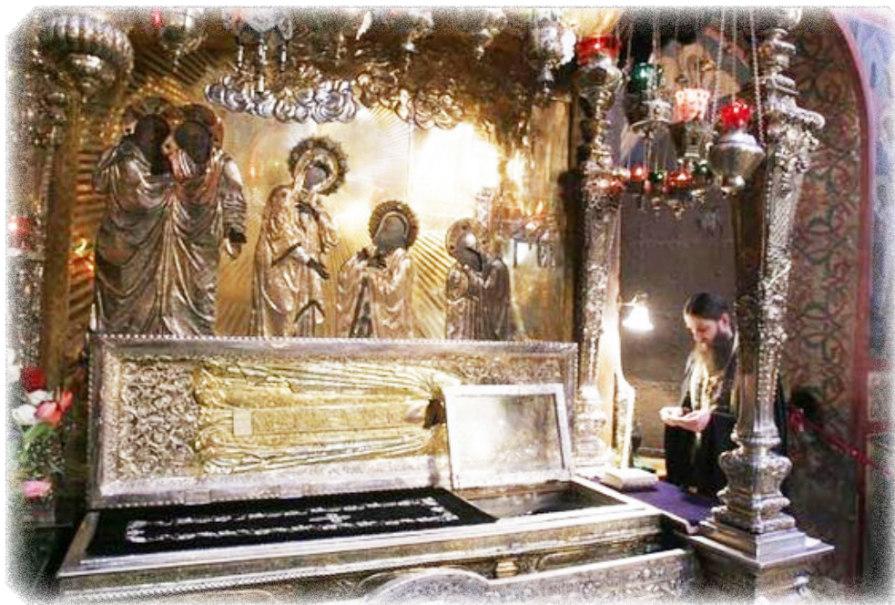
ТРОИЦЕ-СЕРГИЕВА ЛАВРА. Мощи преподобного Сергия Радонежского

пожертвованием хлеба и других съестных припасов. За свои великие подвиги св. Сергий еще при жизни был удостоен великой благодати от Бога и уважения от людей. Так, когда братья его обители сетовали на отдаленность воды, молитвой он извел в ближайшем лесу источник, который существует до сих пор; воскресил сына одного из окрестных жителей; предсказал великому князю Дмитрию Донскому победу над татарским ханом Мамаем; однажды явилась ему в келье Пресвятая Богородица со святыми апостолами Петром и Иоанном; слышен был ему голос Божий, что обитель его не будет оставле-