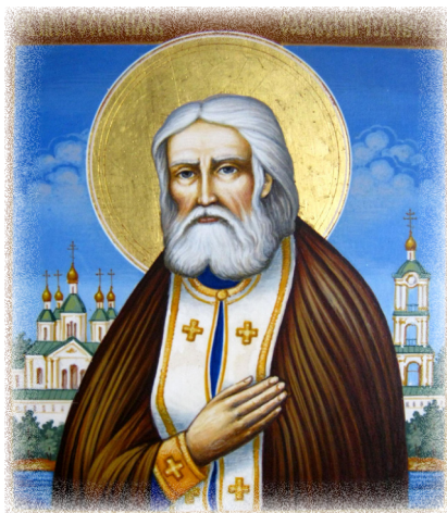
прп. Серафим, Саровский чудотворец

Попробуй, когда тебя бьют до смерти, горбатым тебя делают, попробуй простить.