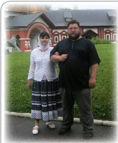
Сбор пожертвований продолжается в нашем храме